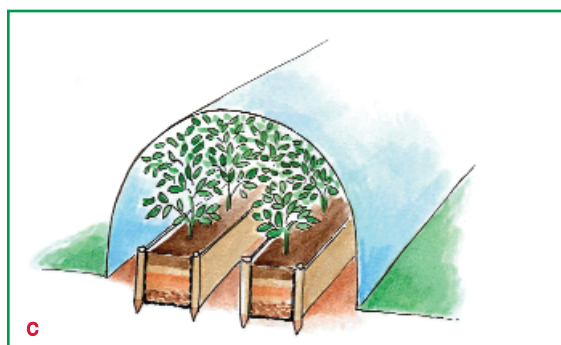
Zasada budowy podwyższonej grządki (a) oraz zagonu (b,c)